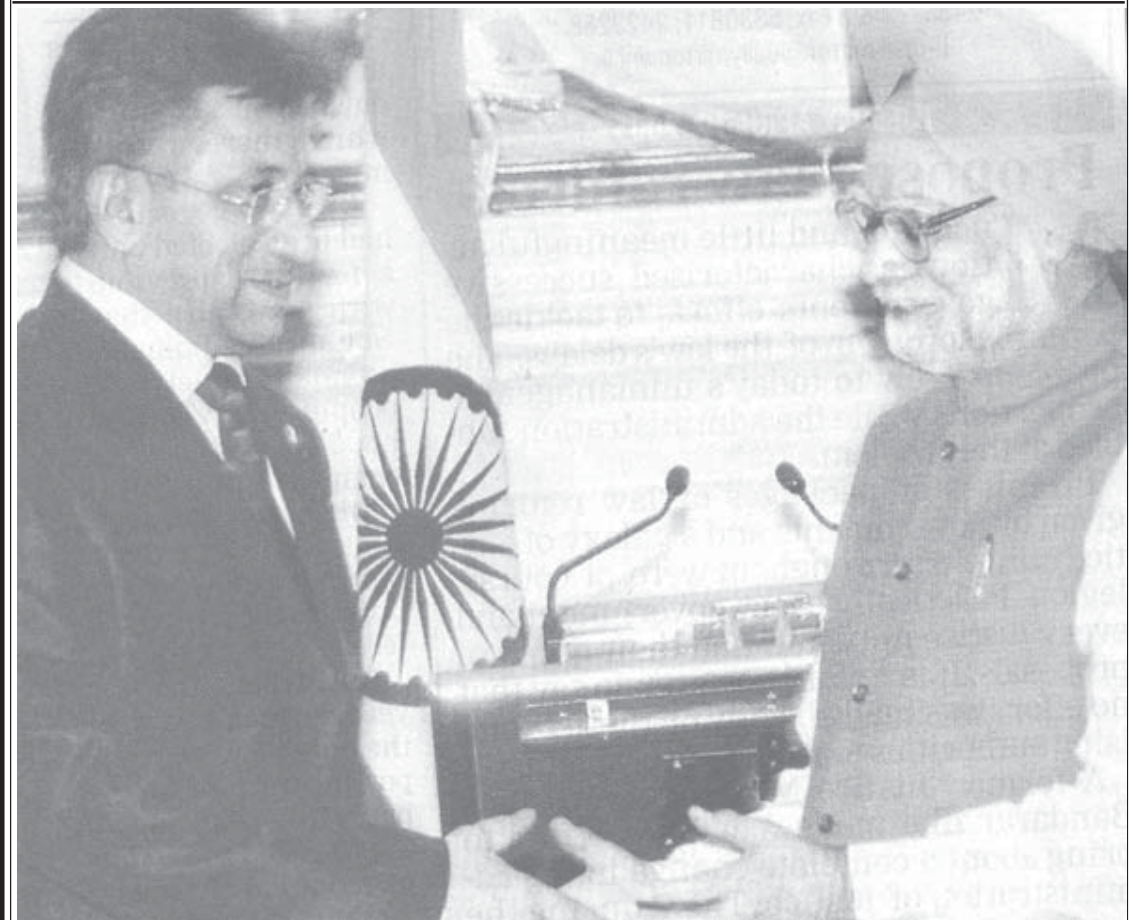
இந்தியா - சீனா - இந்தியா - பாசிஸ்தான் எல்லை கடந்த உறவு தென்னாசியாவின் புதிய அத்தியாயம்