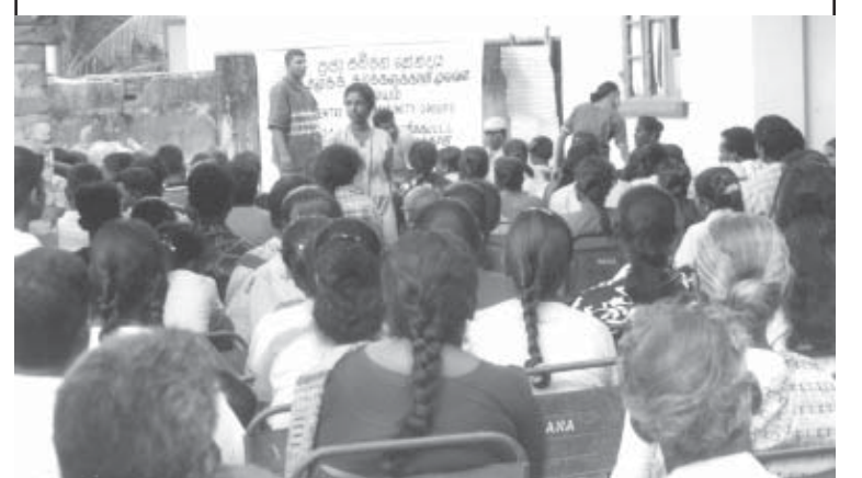
கனாமியால் பாதிக்கப்பட்டவர்களுக்கு இயன்றவரை உதவி